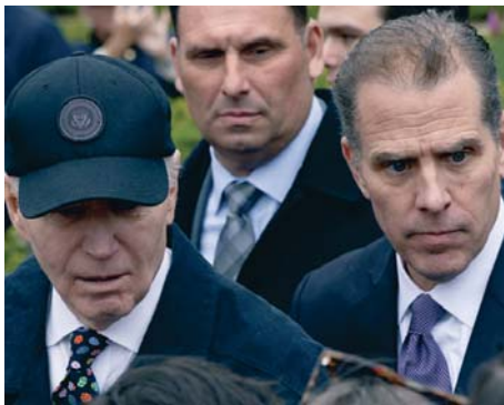
El presidente de EEUU, Joe Biden, y su hijo Hunter Biden.

Hunter Biden había sido declarado culpable de haber