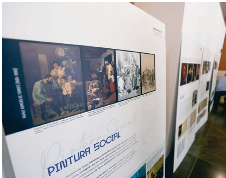
Documentos, fotografías, recortes de prensa e ilustraciones recrean la época del pintor Julio Romero de Torres.