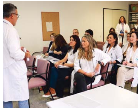
Jornada formativa en el Juan Ramón Jiménez.

joras diagnósticas y tratamientos para esta compleja enfermedad a fin de aumentar la calidad de vida de estas personas, junto a la Asociación Valverdeña de la Enfermedad de Andrade (Asvea). La provincia de Huelva se sitúa "entre los diez focos endémicos más importantes del mundo", con un "destacado núcleo" en Valverde del Camino.