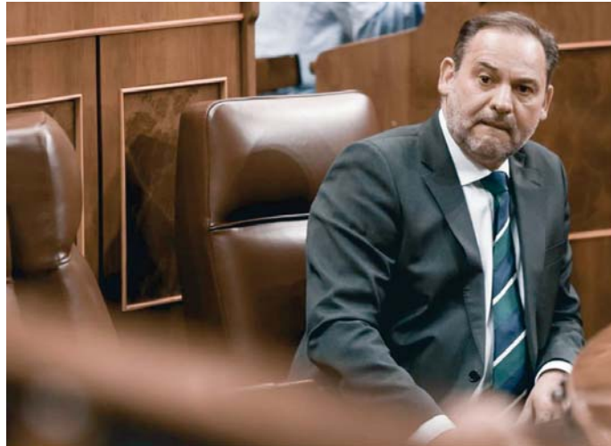
El exministro José Luis Ábalos en el Congreso de los Diputados.

Sin embargo, aclara el juez, la Audiencia Nacional deberá continuar con la investigación respecto a todos los demás imputados -que llegaron a sumar en torno a una veintena-, y también respecto a hechos atribuidos a De Aldama y Koldo García que no guarden relación con Ábalos, como presuntos delitos contra la Hacienda Pública y/o de blan-