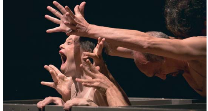
Una de las escenas de 'El Festín de los Cuerpos', con la que han viajado a Alemania e Italia.

La danza es el otro gran aliado de Danza Mobile para la transformación social y como motor para la inserción laboral de personas con discapacidad. Y lo demuestra el calendario de actuaciones de la