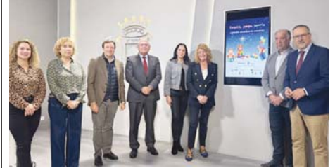
Presentación de la campaña. VH

SOLIDARIDAD Campaña ‘Regala, juega, sonríe’