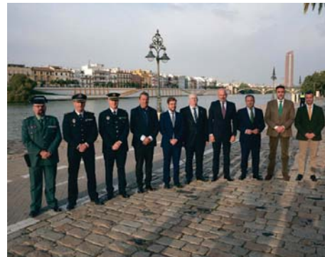
Presentación del dispositivo especial.

La empresa municipal TUS-SAM reforzará su servicio con un aumento del 40% en su oferta el sábado y del 80% el domingo. Además, se habilitará una lanzadera circular para conectar las zonas de aparcamiento con el recorrido de la procesión. La Policía Local movilizará a 975 agentes que, en coordinación con la Policía Nacional, supervisarán la seguridad del evento. El dispositivo médico incluye un hospital de campaña en Marqués del Contadero.