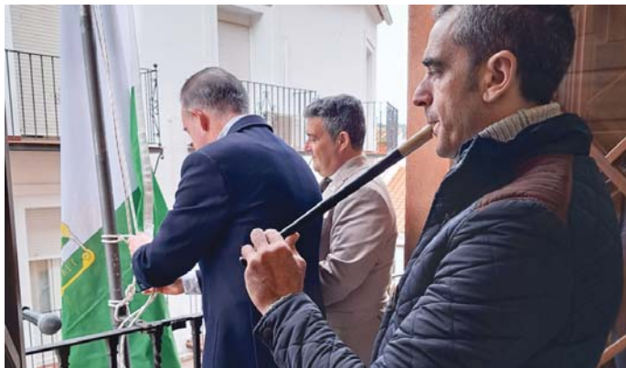
Momento del izado de la Bandera de Andalucía en el balcón del Ayuntamiento de Aracena. V.H.

BANDERA DE ANDALUCÍA Fue en el Consistorio de Aracena