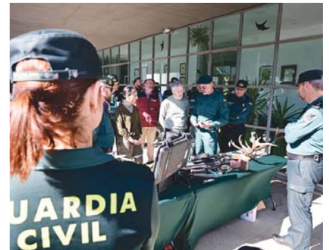
Marlaska con el Seprona en Doñana. VH

El Seprona trabaja para detectar y frenar actividades ilegales que puedan afectar a la preservación de la naturaleza, “como la caza furtiva, la utilización de productos fitosanitarios prohibidos en las explotaciones agrícolas o la extracción irregular de agua para regadío”, ha precisado el ministro, que después ha recorrido el entorno de Doñana.