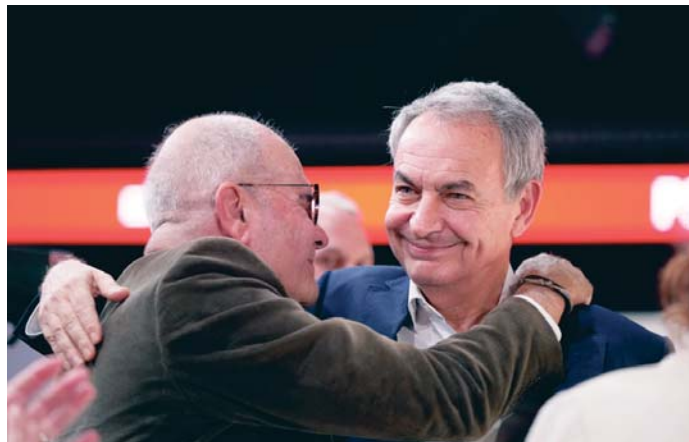
El expresidente José Luis Rodríguez Zapatero (d) saluda al expresidente de la Junta, Manuel Chaves.