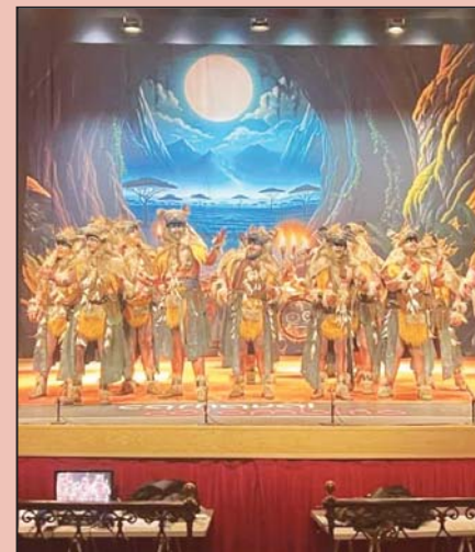
Tres de las agrupaciones de la primera jornada de semifinales: 'Por mi tierra, la revolución de los fantoques', 'Guadiana' y 'Luna Llena'.