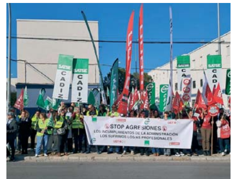
Concentración ante el centro de salud de Las Delicias. AI

de la sanidad pública, debido a su abandono, deterioro e inacción para ejecutar las medidas necesarias, empezando por el cumplimiento de los acuerdos como el de Atención Primaria que beneficiarían a los ciudadanos". Los sindicatos entienden la "frustración" de la población por los "problemas de recursos" en la sanidad pública, pero insisten en que "esto nunca justifica las agresiones hacia los profesionales, quienes no son responsables de la situación y están haciendo todo lo posible para mantener la calidad de la atención".