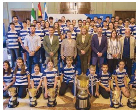
Formación del Recreativo IES La Orden con sus equipos de cantera.