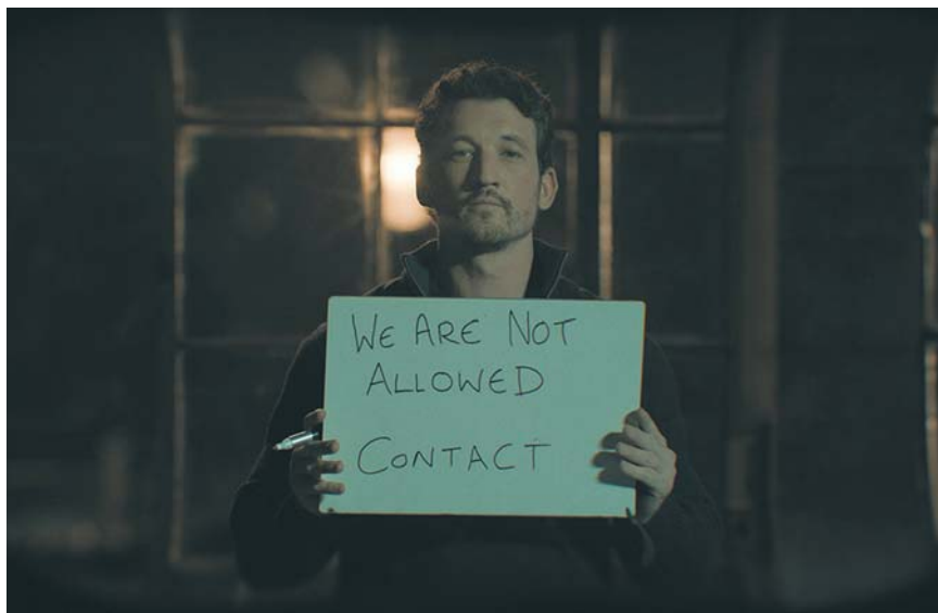
Miles Teller, desde su torre de vigilancia, mostrando un mensaje a Anya Taylor-Joy, en la torre de enfrente.

La primera película, la más interesante, es la que se centra en la pareja protagonista, interpretada por Miles Teller y Anya Taylor-Joy, la que sigue