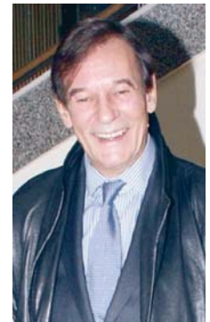
Tony Isbert.

AMITHe ha anunciado que solicitará que uno de los camerinos del Teatro Circo de Albacete lleve su nombre “como recuerdo permanente”.