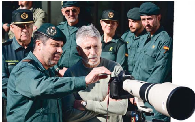
El ministro Marlaska, este jueves con efectivos del Seprona en Doñana. VII

"Este operativo -del que se dio cuenta este jueves en Viva Huelva- tuvo cuatro fases y en el conjunto de las cuatro se detuvo a 12 personas, en colaboración y cooperación con las autoridades portuguesas. Se incautaron más de 5.000 kilos de hachís y también armas, entre ellas un arma de guerra. Nuestro esfuerzo, el esfuerzo de las Fuerzas y Cuerpos de Seguridad del Estado y tam-