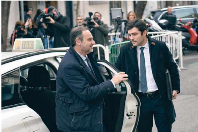
El ex ministro de Transportes José Luis Ábalos (c) llega a declarar al Supremo.

El magistrado acuerda lo solicitado por Anticorrupción al considerar que estas medidas resultan “precisas” -“en atención a la particular gravedad de los hechos delictivos”- para “asegurar” que Ábalos “no pueda en lo porvenir sustraerse a la acción de la justicia”. Entiende también que son “plenamente proporcionadas” porque “solo de forma ligera e indispensable limitan el ejerci-