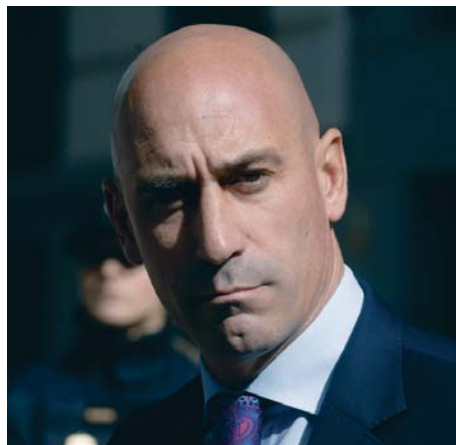
El expresidente de la RFEF Luis Rubiales.

A lo largo de 36 páginas, el juez concluye que, durante la entrega de medallas tras la victoria en el Mundial de Sid-