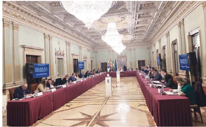
Último pleno ordinario del Ayuntamiento, celebrado en el mes de enero.

MUNICIPAL Cambios en las áreas y dos nuevos reglamentos, a pleno