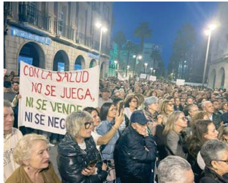
Multitudinaria protesta ante la Delegación de Salud. VGPALACIOS

“Esto era muy necesario. En Huelva partíamos de una situación muy deficitaria de base y hemos llegado a una situación que ha implosionado. Ya no aguanta más el personal, ni los medios que tenemos. Ya no solo está en juego la salud laboral del trabaja-