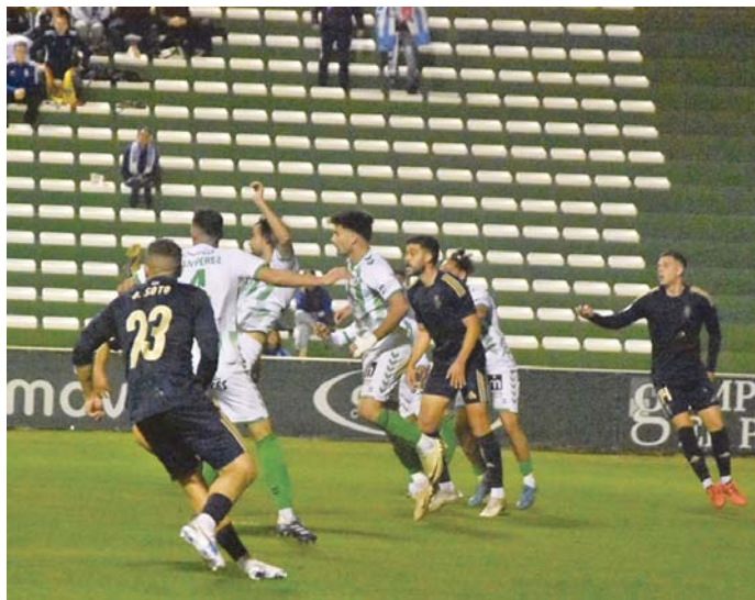
Un instante del Antequera-Recreativo de Huelva del partido de ida en tierras malagueñas. TENDR

El Recreativo tendrá que hacer un partido muy serio y no cometer errores ante un rival que no te perdona arriba pero al que se le puede hacer daño en defensa, no en vano el Fuenlabrada le hizo cuatro goles y la UD Ibiza cinco en pasadas semanas. Se espera la mejor versión del Decano si