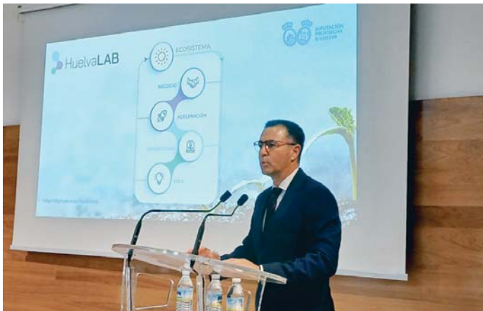
Presentación de HuelvaLAB. VH

Arias ha destacado que desde la Diputación Provincial están “muy ilusionados” con este proyecto que se pone en marcha y que es “pionero”, con el que se va a convertir este espacio en “un centro de referencia” en materia tecnológica y agroforestal, aprovechando las nuevas tecnologías “para que todo el sector agroforestal se adapte a las