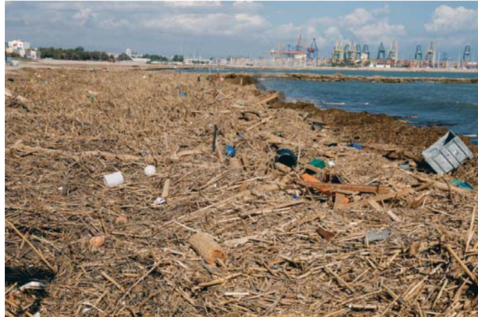
Continúan las labores de rastreo en La Albufera. En la imagen, la Playa de El Saler, en Valencia.

Más de 500 arquitectos se han inscrito ya en la bolsa creada por el Colegio de Arquitectos de Valencia para co-