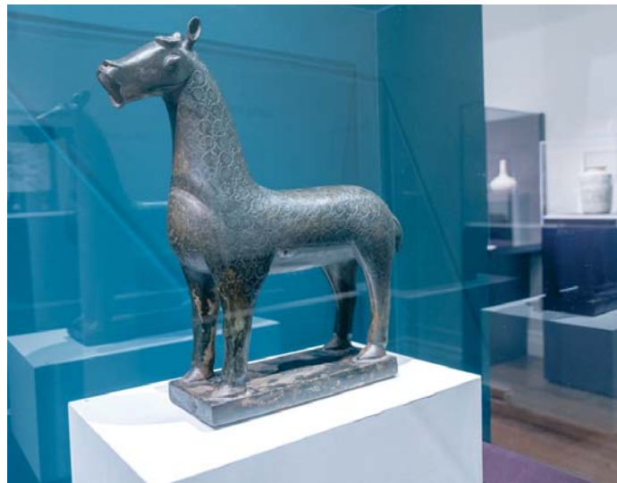
Un surtidor de fuente en forma de cervatillo del siglo X D.C., exhibido en la muestra.

A mediados del siglo X, la dinastía de los omeyas reinaba indiscutiblemente en Al Andalus y había hecho de Córdoba la ciudad más grande y desarrollada de toda Europa, con grandes avenidas y un sis-