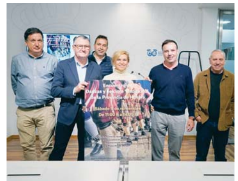
Presentación del Encuentro. VH

dro, Alosno, Aroche, Villanueva de los Castillejos, Almonaster la Real, Cabezas Rubias, Cañales, El Cerro de Andévalo, Encinasola, Hinojales, Puebla de Guzmán, San Bartolomé de la Torre, Sanlúcar de Guadiana, Villablanca, Villanueva de las Cruces y Zalamea la Real. Se calcula que este pasacalles logrará reunir a más de 300 participantes.