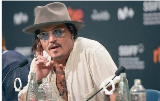
Johnny Depp estará en Sevilla tres días para presentar su último largometraje en el SEFF.

Antes, el viernes, Meet the barbarians (Conoce a los bárbaros), la nueva película de la actriz, cantante, compositora, directora, guionista y productora francoestadounidense Julie Delpy, abrirá la 21 edición del Festival de Cine Europeo de Sevilla. El recuperado y renovado Cine Cervantes acogerá el estreno nacional de la película, que se proyecta fuera de competición.