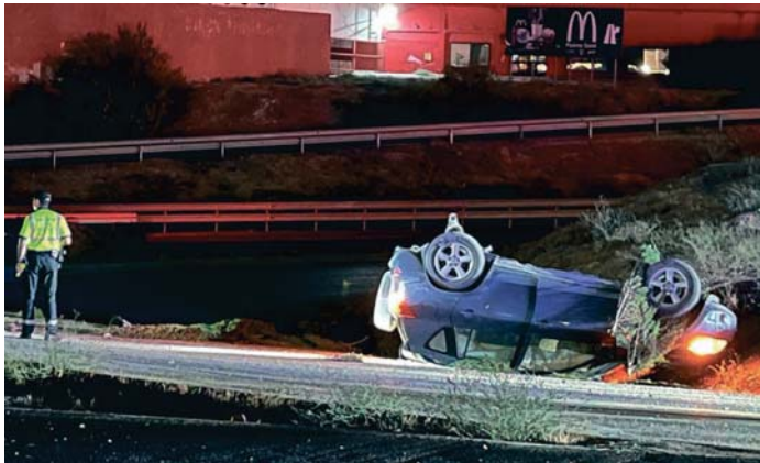
Estado en el que quedó un vehículo que se salió de la vía. VIVA

Delos 6.500 fallecidos en accidentes de tráfico nocturnos entre 2013 y 2023 más de