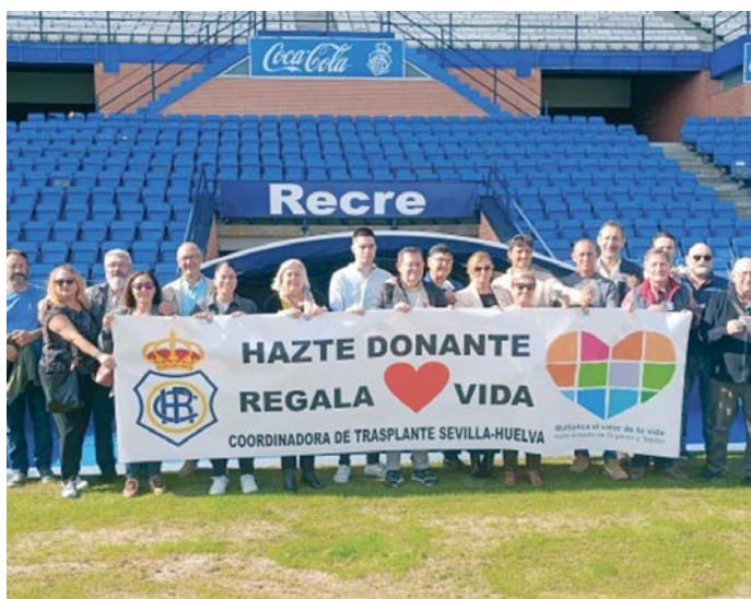
El Recreativo de Huelva con la Donación de Donantes de Órganos y trasplantes. TENOR

Además, en el plano solidario, el Recreativo de Huelva, no podía quedarse al margen de todas las iniciativas que se están llevando a cabo para recaudar fondos económicos y todo tipo de alimentos y enseres para ayudar a los miles de afectados por la dana de Va-