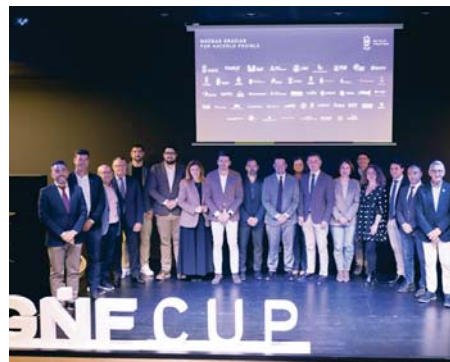
Presentación oficial de la X Gañafote Cup. VH

Se espera la llegada de más de 40.000 visitantes, 17 hoteles de la provincia, 350 equipos y un impacto económico que supera los dos millones de euros.