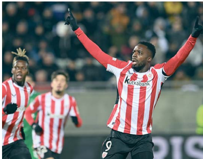
Iñaki Williams (dcha) celebra el gol del empate ante el Ludogorets búlgaro.

El Viktoría Pilsen fue a menos con el paso de los minutos, pero en el 89, tras un rechace de la defensa de la Real, Kalvach disparó desde fuera del área, el balón dio en su compañero Vasulin, cambió la trayectoria y Remiro no pudo alcanzarlo. Lo intentó el conjunto realista en los instantes finales, pero no consiguieron equilibrar la balanza.