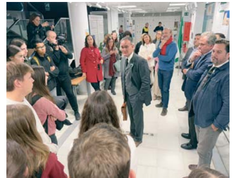
Explicación teatralizada de la exposición. VH

Además de la exposición, a la que han asistido alumnos de cuarto de la ESO del IES Pablo Neruda de Huelva, se ha organizado una explicación teatralizada a cargo del grupo Platalea, interpretando a Blas Infante, sobre cómo se consiguió la Autonomía para Andalucía. La muestra permanecerá disponible hasta el 13 de diciembre.