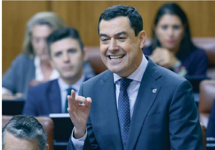
El presidente de la Junta de Andalucía, Juanma Moreno, durante la sesión de control.

Las consecuencias de la dana que ha devastado nu-