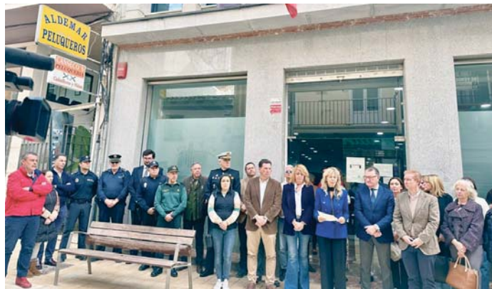
Lectura del manifiesto a las puertas de la Subdelegación. VH

VIOLENCIA DE GÉNERO Lectura de un manifiesto en la Subdelegación