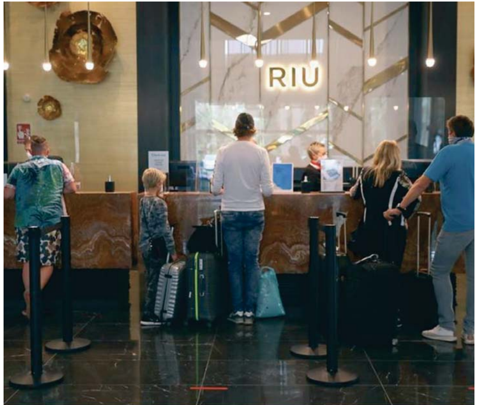
Viajeros en la recepción del Riu Palace Oasis Maspalomas.

Los obligados son los hoteles, hostales, pensiones, casas de huéspedes, hostales de turismo rural, cámpines, zonas de autocaravanas, apartamentos, bungalows, entre otros