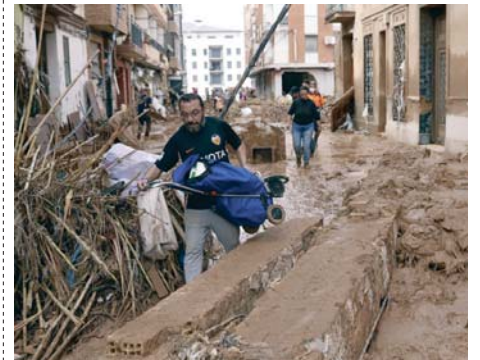
Un vecino se abre camino entre el fango y los escombros.

Los eventos de precipitación extrema son frecuentes en el área mediterránea “por la intrusión de aire frío acarreado por la dana y por los vientos del este que traen aire cálido y húmedo del Mediterráneo hacia el interior”