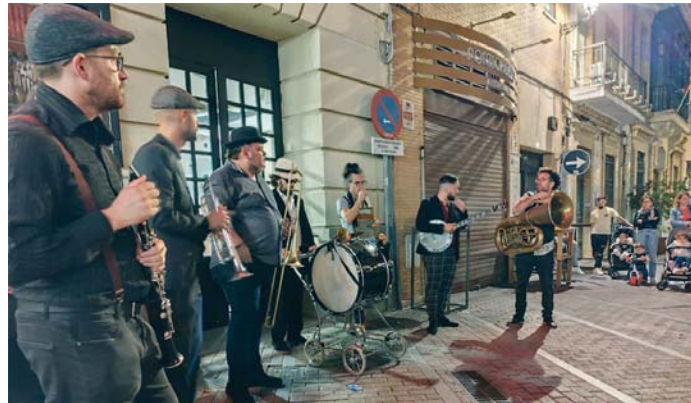
El pasacalles de la banda Choco's hot seven, este jueves en el Gran Teatro. VH