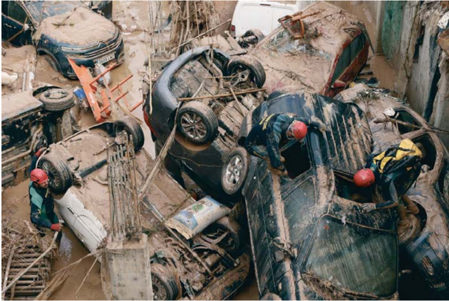
Expertos de la Guardia Civil buscan cuerpos sin vida entre los vehículos siniestrados tras la riada en Paiporta, Valencia.