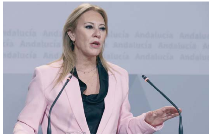
La consejera de consejera de Economía, Hacienda y Fondos Europeos, Carolina España.

Carolina España indicó que el Gobierno andaluz está "en desacuerdo" con la política fiscal que aplica el Ejecutivo de la nación, de la "asfixia fiscal" a la que somete a los ciudadanos, ya que el esfuer-