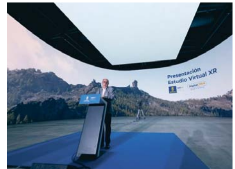
Presentación del estudio virtual Platós.

XR, el quinto de España, se encuentra en uno de los dos platós "únicos en Canarias", que operan desde 2022 tras una inversión de 10 millones que corrió a cargo de la corporación insular, concretamente en el de 1.200 metros cuadrados, al que se suma otro superior, de 1.800 metros cuadrados.