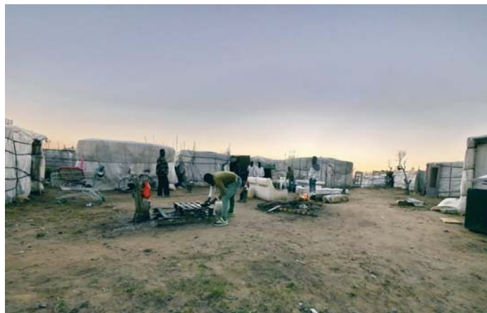
Imagen de un asentamiento chabolista de la provincia de Huelva.

Desde Huelva Acoge se interviene en 16 de estos asentamientos con una población de aproximadamente 1.000 personas fuera de la temporada agrícola. Durante la campaña