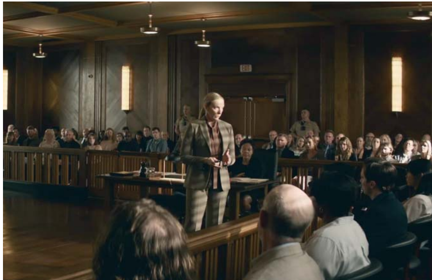
Toni Collette realiza una magistral interpretación en la piel de la fiscal que lleva la acusación del caso.

De fondo, un thriller judicial con más peso dramático que intriga, y sobre el que pesa la alargada sombra de Doce