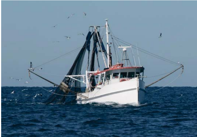
Pesca en el Golfo de Cádiz. I.A.

Por esta razón, desde la Federación se ha instado al Mi-