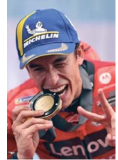
Marc Márquez.

Esta vez dio la impresión de que a Marc Márquez le costó algo más superar a su hermano, Alex, quien supo aprovechar a la perfección el error de su familiar en una apurada de frenada en la que entró colado, pero cuando todo parecía apuntar a que el ocho veces campeón se iba a conformar con la segunda posición, decidió pasar al ataque. No lo tuvo fácil Marc Márquez, hasta que se perca-