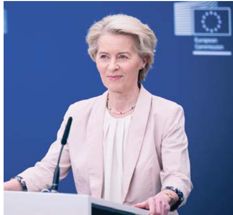
La presidenta de la CE, Ursula von der Leyen.

En lo relativo a la posibilidad de crear un ejército entre los 27 países de la UE, los votantes del PNV son los que