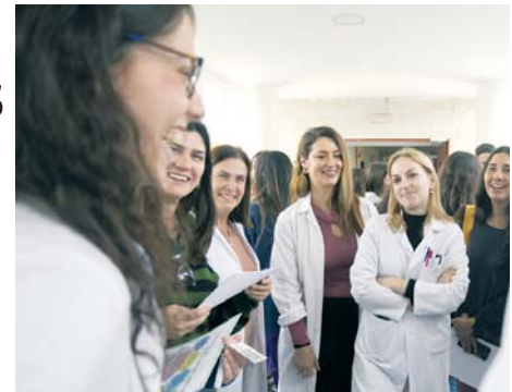
Residentes del Hospital Juan Ramón Jiménez. VH

de Puertas Abiertas destinada a médicos, farmacéuticos, psicólogos, enfermeros y a físicos que acaban de aprobar el examen EIR. Una cita para conocer de cerca el centro y toda la información que necesitan de las diferentes especialidades, resolviendo sus dudas, “para ayudarles a decidirse, ya que se encuentran en la fase de seleccionar el hospital”.