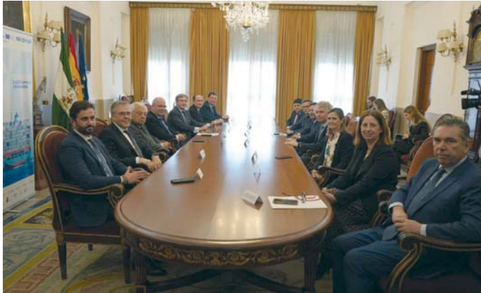
La reunión de anexión a Nexomar. CCA

Andalucía subrayó "la importancia de la colaboración público-privada para el desarrollo portuario y logístico, además de resaltar la aportación de herramientas innovadoras y cooperativas que está impulsando este proyecto y que están siendo de gran utilidad al tejido empresarial de ese sector". Además, apostó por "la suma de esfuerzos y recursos y la complementariedad para aprovechar al máximo la potencialidad y posición estratégica de la fachada atlántica que conforman Andalucía y el sur de Portugal".