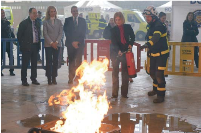
La alcaldesa, en presencia de la Infanta Elena, participa en una actividad sofocando un incendio.

ción será un año más la importancia de ubicación de los detectores de humos y actuación ante situación de incendio en un hogar, así como el conocimiento de los riesgos que lo originan y medidas preventivas.