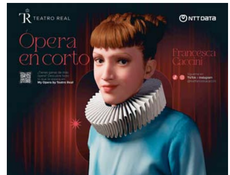
Cartel promocional de la iniciativa. TEATRO REAL

La compositora se ha convertido de este modo en protagonista de una serie de programas titulados 'Ópera en corto', donde desvela a los espectadores los secretos de una producción operística con explicaciones sobre el libreto, la música, el contexto histórico y social o anécdotas relativas a cada título.