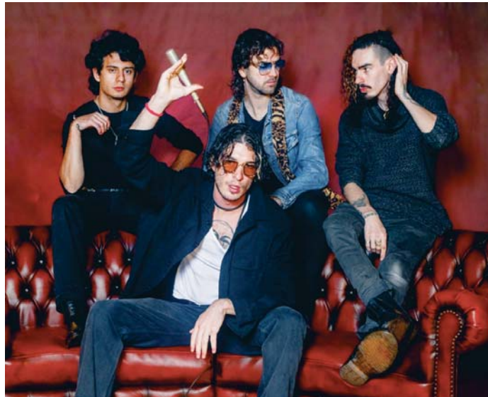
Los cuatro miembros de la banda de rock madrileña 'Ultraligera'.

Coque habla, de su lado, de un "proceso natural que ha ido muy rápido" y que les ha llevado de abrir festivales a las 17.00 horas "tocando para nadie" a escalar posiciones tanto en carteles como en franja horaria. Una naturalidad de proceso en el que les han acompañado "un muy buen público", lo que le hace pensar que este 2025 será "la consagración del