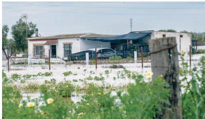
Viviendas afectadas por la crecida del Odiel en el término de Gibraleón. DIPU

primeras horas de la mañana, tenía como objetivo garantizar la seguridad de los habitantes de la zona. Por ello, aunque el nivel del agua descendió considerablemente a media tarde, no se autorizó el acceso a las viviendas afectadas.