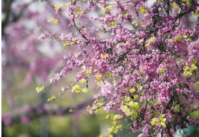
La llegada de la primavera supone la floración de un buen número de plantas.

Como cada año, la llegada de la primavera traerá consigo el cambio al horario de verano. Este ajuste se realizará en la madrugada del domingo 30 de marzo, cuando a las 2.00 horas los relojes deberán adelantarse una