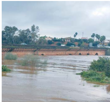
Río Tinto a su paso por Niebla, con el agua casi al límite del puente.

El Ayuntamiento de Niebla informó de la "notable crecida" del caudal del río Tinto, "un fenómeno poco común que está teniendo lugar en estos días", por lo que pidieron "máxima precaución a quienes transiten por zonas cercanas al río, especialmente en caminos y puentes", toda vez que demandaron a los ciuda-