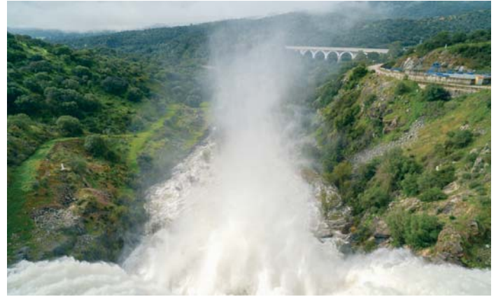
El embalse de Los Melonares en pleno desagüe para regular su capacidad.

En el caso de la provincia de Málaga, se presta atención a los embalses de La Concepción, en la Costa del Sol, puesto que se encuentra al 82,66 por ciento, mientras que el de Casasola es el único de la vertiente mediterránea que está al cien por cien de su capacidad. La Junta también se encuentra pendiente del embalse del Conde de Guadalhorce, que está al 93,35 por ciento.