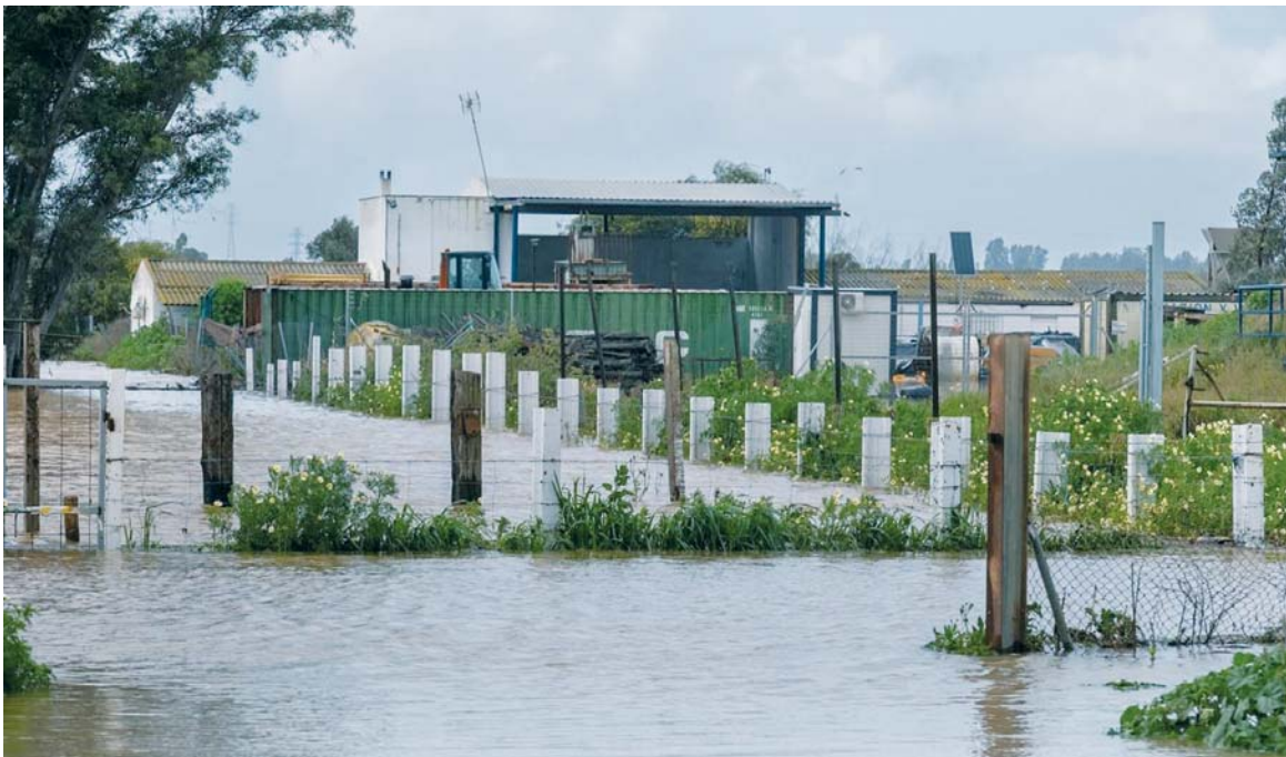
Zona de viviendas en Gibraleón que se han visto afectadas por la crecida del Odiel y ha provocado el desalojo de varias personas.

PRESAS Seis de las ocho del sistema Tinto-Odiel-Piedras “están al 100% y están aliviando” PELIGRO Evacuadas nueve personas de cinco viviendas en Gibraleón por la crecida del río Odiel ALERTA Niebla y Bonares llaman a la precaución por la crecida del río Tinto CAPITAL Activa el Plan de Emergencia Municipal en nivel 1 en prevención