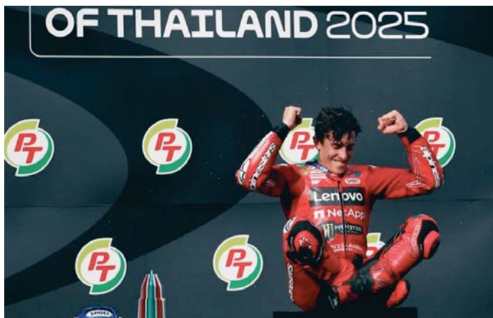
Marc Márquez celebra su victoria en la primera prueba del mundial.

Una vez más Marc Márquez no falló en la salida y se puso al comando de la carrera nada más apagarse el semáforo rojo, mientras que Pecco Bagnaia le ganó la posición a Alex Márquez, que se tuvo que salir de pista en las dos primeras curvas regresó en la cuarta