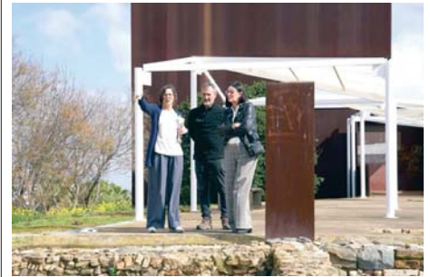
La rectora y el responsable de Platalea en el Cabezo. VH