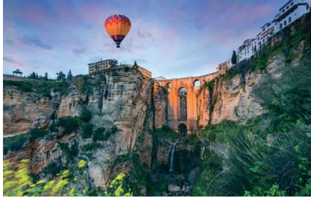
Un globo aerostático cruzando por la ciudad patrimonial de Ronda. GLOBOTUR

Pero Globotur no sólo quiere que el cielo sea admirado, sino que también sea valorado. "¿Por qué no convertir lo intangible en tangible?", se pregunta Benítez. La idea de declarar el cielo andaluz como Bien de Interés Turístico surgió tras analizar la normativa vigente y constatar que su propuesta cumple con todos los requisitos.