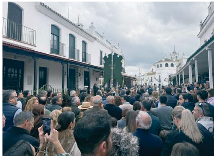
El Simpecado de Huelva, avanza arropado por sus hermanos, hacia la misa de peregrinación. AYTO

HERMANDAD HUELVA La convivencia del viernes en Gato se suspendió