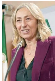
La consejera de Salud. VH

Toscano ha incidido en el trabajo colectivo que viene realizando la Comisión, en la que tienen voz la totalidad de las administraciones y agentes sociales y económicos, para establecer de forma unánime las infraestructuras prio-