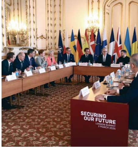
Cumbre de líderes europeos en Londres.

Starmer aseguró que hay “varios países” dispuestos a participar en esta iniciativa. “Varios países han indicado hoy que quieren ser parte del plan que estamos preparando. Voy a dejar que sean ellos