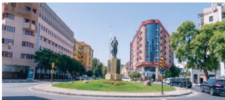
Rotonda de Los Litri de Huelva capital.

En cuanto a la edad de esta población y agrupándola en grandes grupos, el 42,3% tiene 65 o más años, el 28,09% tiene entre 45 y 64 años y el 2,4% es menor de 15.