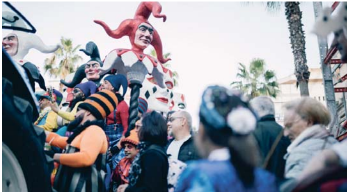
Un momento de la cabalgata del sábado.

Sin embargo, los onubenses pudieron desquitarse, por todo lo alto, con una cabalgata que llenó de papelillos, de música y de color la ciudad y que tuvo un fin de fiestas para recordar en la plaza de La Merced, escenario también