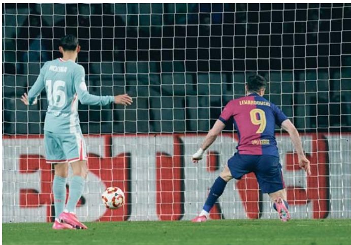
Robert Lewandowski (d) marca su gol número 34 de la temporada ante la Real.

La derrota ante el cuadro donostiarrero en San Sebastián abrió el noviembre negro que apartó al Barcelona del liderato. Ahora recupera el mando de LaLiga en solitario con un punto de ventaja sobre el Atlético de Madrid y tres respecto al Real Madrid, que perdió el sábado en Sevilla ante el Betis (2-1).