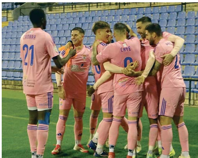
Futbolistas del Recreativo celebrando el tanto de la victoria.

El Recre salió muy enchufado y ya en el minuto 7 de jue-