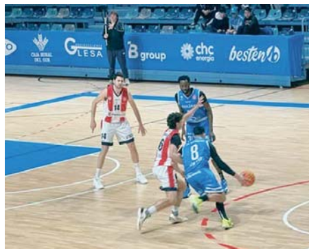
Un instante del Ciudad de Huelva-Algeciras de este pasado sábado.

El Ciudad de Huelva se complica la permanencia en la Segunda FEB, porque ahora su balance de victorias y derrotas se sitúa en 9-10, con lo que solo tiene una ventaja de dos partidos sobre el descenso, cuando quedan por disputarse siete jornadas, que se pueden convertir en un calvario para el conjunto onubense.