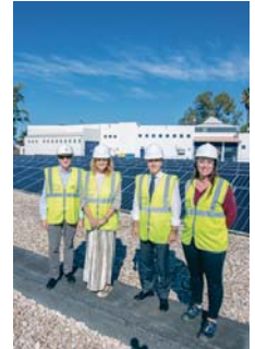
Visita a la ETAP. VH

El ahorro energético total ahora es de unos 800.000