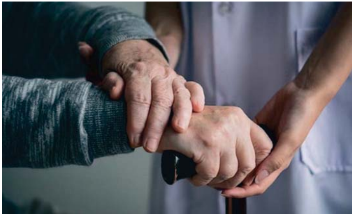
Un informe señala que el sistema ha ido degradándose progresivamente desde su creación.

El sistema ha virado hacia un modelo asistencialista, donde las prestaciones económicas vinculadas han ganado peso, afectando la igualdad en el acceso a los servicios. En lugar de recibir la atención directamente de