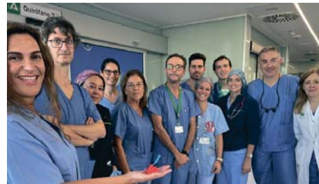
Grupo de especialistas del Hospital.

De hecho, el bebé ha tenido una evolución satisfactoria tras la cirugía y en la actualidad está de alta en su domicilio en Portugal, siguiéndose ya de forma ambulatoria en su hospital de referencia en Lisboa.