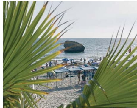
Playa de Matalascañas. VH

El proyecto de regeneración de arena aprobado recientemente por el Ministerio para la Transición Ecológica, que prevé una inversión de 6 millones de euros y la aportación de 700.000 metros cúbicos de arena, "es un paso importante, pero insuficiente frente a la situación actual", han concluido.