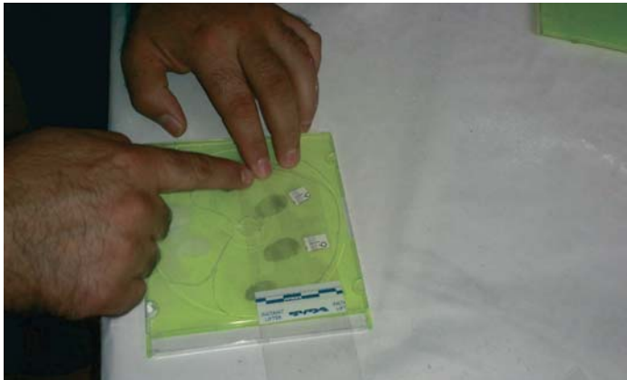
La Policía Judicial no le tomó las huellas dactilares. VIVA

Tras pasar una noche en los calabozos fue puesto a disposición judicial, donde se le