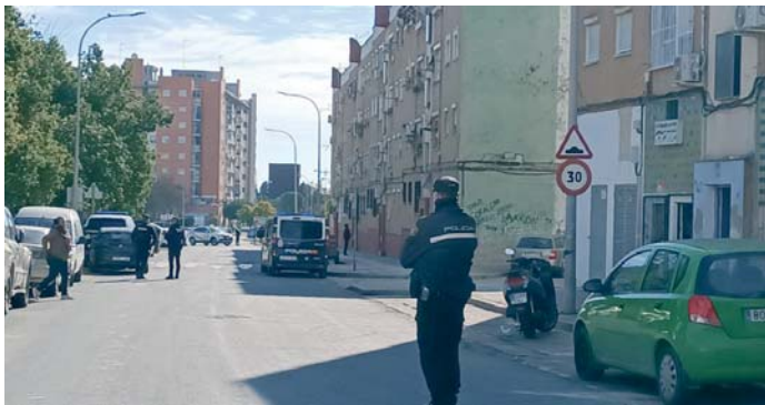
Imagen de archivo de un agente de la Policía Nacional en el barrio de El Torrejón.

Se dio aviso entonces a la Policía Local y a la Policía Nacional, confirmando los agentes de este último cuerpo de seguridad al 112 que en la zona “había rastros de que había habido un tiroteo”, al tiempo que informaban de