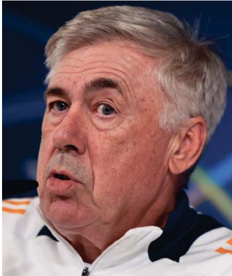
Carlo Ancelotti en la rueda de prensa.

Centrado ya en una semana importante, Carletto enfocó el primero de los dos partidos