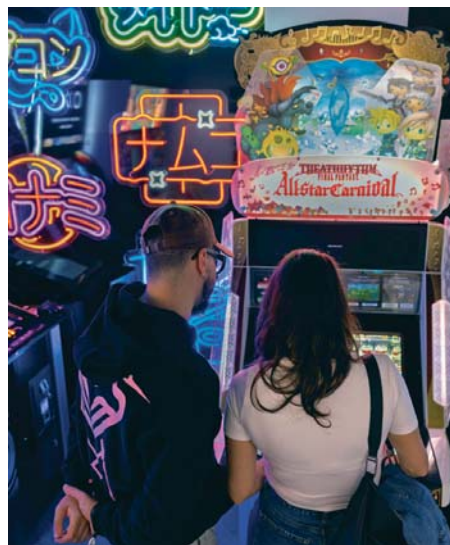
Instalaciones de OXO Museo del Videojuego de Málaga.

Hay videojugadores que se reúnen cada año físicamente, y las instalaciones existentes son un estímulo. “Nos están llamando para hacer esas quedadas en Málaga y realizar una concentración juntos en Home of Giantx”, un espacio de más de mil metros cuadrados con grada para 70 personas y zona de