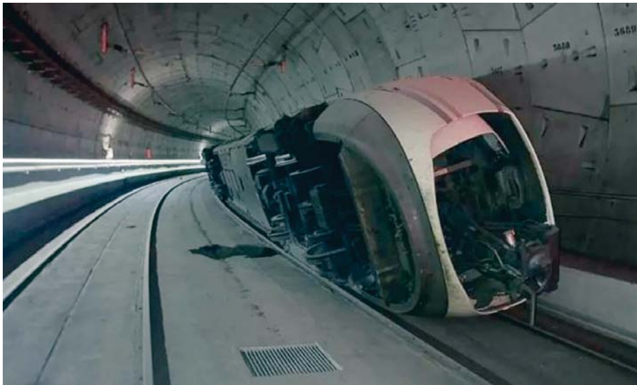
Estado en el que quedó el tren descarrilado en el túnel que une en Madrid las estaciones de Atocha y Chamartín.