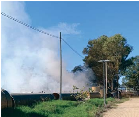
Incendio en la zona ocupada por indigentes junto al Muelle del Tinto.

Domínguez hace hincapié en que, por ahora, todo se ha quedado en un susto, pero la zona está pegada al Muelle del Tinto, un BIC y además de