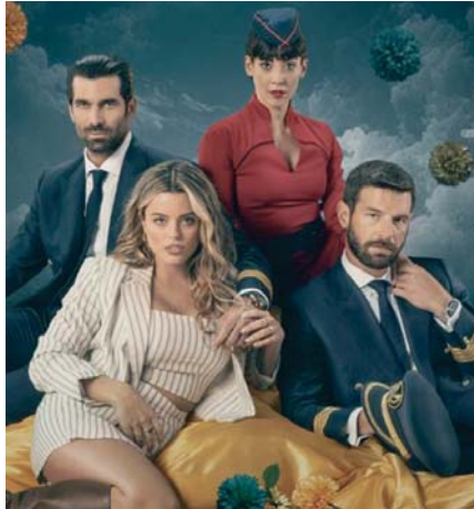
Cartel promocional de la serie de televisión.

De esta manera, la serie sigue la historia de Sonia Beched (Torrebejano) una empresaria y madre soltera que, tras la decepción amorosa que vivió con el padre de su hija Ibiza, no espera a ningún hombre, pero disfruta del sexo sin compromiso. Todo cambia cuando en una de las cenas que organiza su madre conoce a Can Dogo (Cortada),