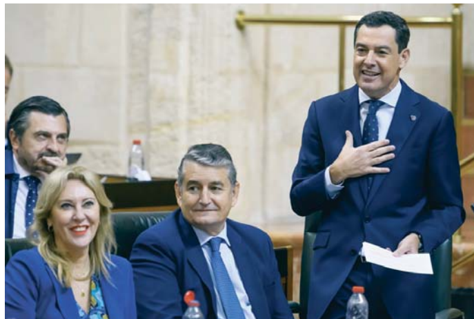
El presidente andaluz, Juanma Moreno, durante la última sesión de control en el Parlamento.

El secretario general del PSOE-A y líder de la oposición en Andalucía, Juan Espadas, aseguró que "nadie" en esta comunidad debería estar satisfecho con los datos de la encuesta, ya que no refleja la gravedad de los problemas reales que sufren los ciudadanos. Tras criticar la falta de transparencia y la metodología del CENTRA, también acusó a Moreno de "jugar con las encuestas que él mismo hace".