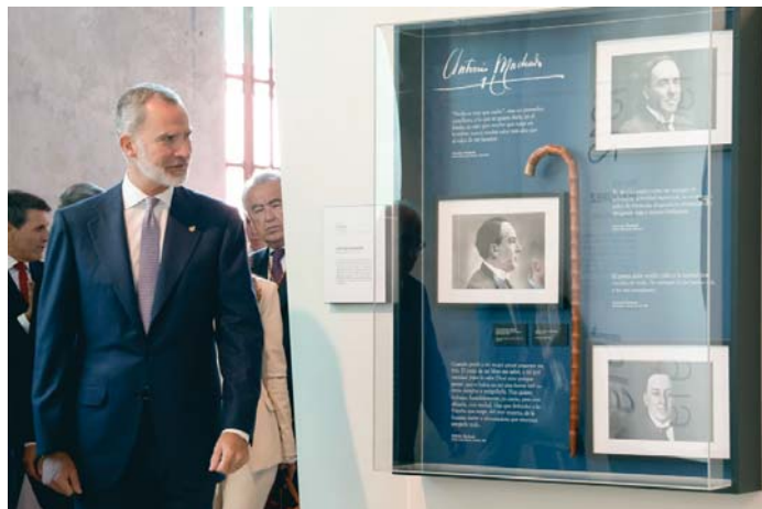
El rey Felipe VI observa uno de los paneles que forman parte de 'Los Machado, retrato de familia'.