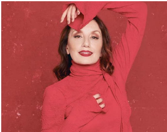
Luz Casal actuará en una gala muy especial para el Festival, la de la inauguración de su 50 edición. VH

IBEROAMERICANO Habrá rostros conocidos en la alfombra roja