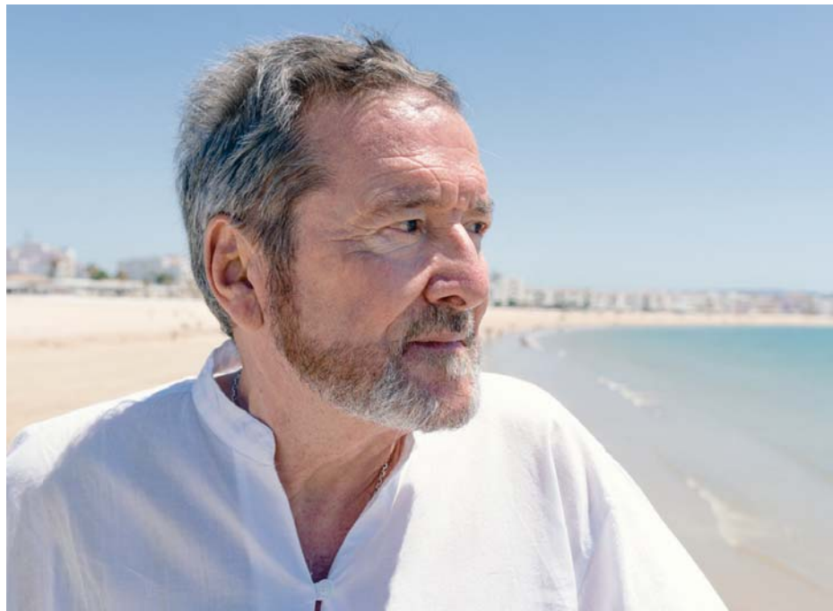
Imagen de archivo del escritor e investigador Juan José Benítez durante su estancia en Barbate.

“En las primeras hay muchos ‘hombres’ extraños, como un hombre pulpo, pero en las figuras de piedra hay numerosos hombres no humanos, con sus naves y al lado de los nativos”