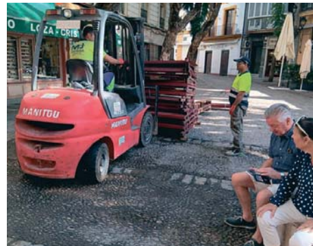
Retirada de las estructuras de la Carrera Oficial. FCA

Además, desde el Gobierno local de Jerez se destaca la "rapidez" con la que han actuado los diferentes servicios municipales.