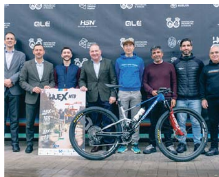
Presentación oficial de la Huelva Extrema 2025. VH

La salida de la HUEX Extrema se dará el sábado a las 7.45 horas en Aracena y pasará por una decena de términos municipales como Trigueros, Beas, Valverde del Camino, Zalamea La Real, Minas de Río Tino, El Campillo, Alájar, Almonaster La Real y Linares de la Sierra, además de los municipios de salida y meta.