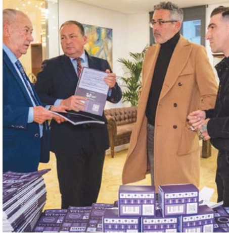
Presentación del álbum de la Semana Santa onubense. V.H.

En esta edición, junto a la capital, quedan inmortalizadas imágenes de la Semana Santa de ocho municipios "con una tradición cofrade profundamente arraigada", como son Aracena,