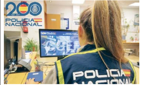
Operación policial contra el fraude en el cobro de prestaciones. VH