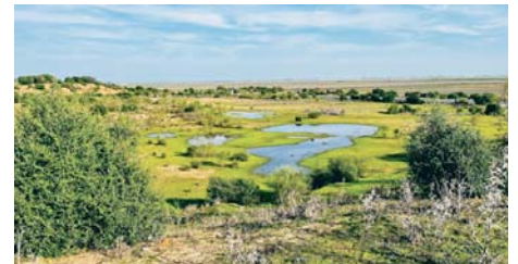
Reserva Natural Dehesa de Abajo. MINISTERIO

Algunas de estas entidades participan en varias iniciativas, como es el caso del Con-