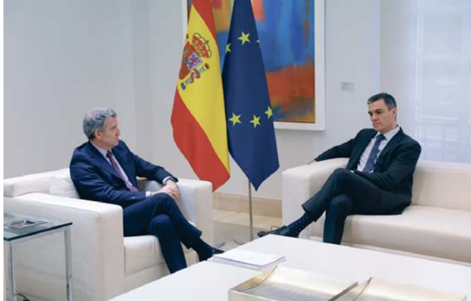
El presidente, Pedro Sánchez, y el líder del PP, Alberto Núñez Feijóo, en el Palacio de la Moncloa.

Feijóo dijo haber constatado que “a día de hoy” España “no tiene ningún plan” y añadió que un Gobierno “que no ha sido capaz de gobernar en la normalidad” está “difícilmente preparado para afrontar la situación extraordinaria”, máxime cuando ni siquiera ha sido “capaz de presentar unos Presupuestos”. “Para más inri como presidente del Gobierno no puede hablar en nombre de todos sus ministros”, criticó, para insistir en que llegó al Palacio de la Moncloa “sin ninguna información” y no puede decir que salga con “alguna informa-