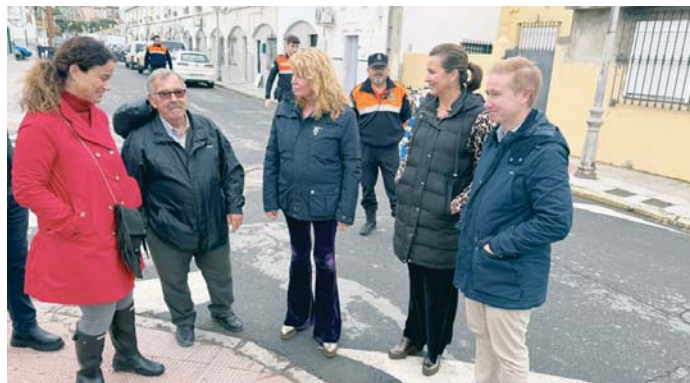
Visita a las viviendas municipales de la barriada de La Navidad.

Según indican desde el Ayuntamiento, en las semanas previas a esta aprobación se ha llevado a cabo "un intenso trabajo" por parte de los técnicos municipales de Vivienda y Urbanismo para "analizar todas las necesidades, identificar las zonas donde era necesario actuar antes y se ha mantenido un contacto permanente con las familias que viven en esas casas".