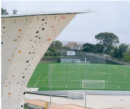
Vista del rocódromo y del nuevo campo de fútbol. VH

En la nueva piscina se ha añadido un graderío, inexistente anteriormente, lo que amplía la capacidad del complejo para albergar competiciones de piscina corta y eventos de mayor envergadura, fo-