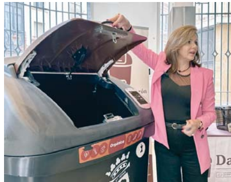
Presentación del nuevo contenedor marrón. VH

con toda la información". Con esa carta, los vecinos deben dirigirse al stand informativo instalado en La Placeta y al presentarla recibirán la tarjeta electrónica que permite abrir el contenedor, un cubo de diez litros que facilita la separación de los residuos orgánicos, un paquete de bolsas biodegradables para su traslado y un folleto explicativo.