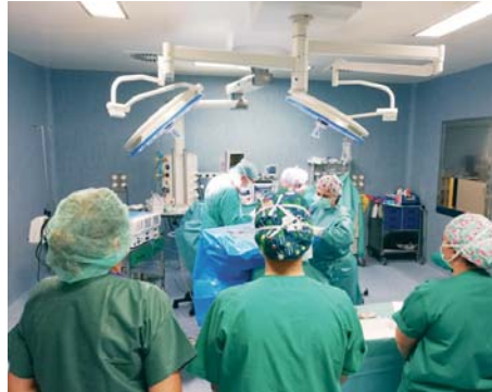
Quirófano de un hospital de Huelva.

“Gracias a esta estrategia, en la provincia onubense se han realizado en este periodo un total de 23.386 intervenciones quirúrgicas, 6.017 más en comparación con 2023, lo que implica un incremento del 34,64%. Esto significa una media al día de 64 operaciones, de las que el 85% se lleva a cabo