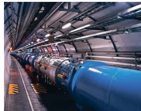
Imagen de un túnel de acelerador de partículas.

La proposición no de ley resalta la necesidad de que “se continúe impulsando la adhesión de socios internacionales al mayor proyecto de este tipo que se construye en nuestro país”. El texto aprobado también incide en que inicien los trabajos, en el marco del Consorcio IFMIF-Dones España, “para promover los mecanismos que permitan la sostenibilidad de esta infraestructura a partir de 2027”. Los socialistas destacan que se trata de un “ambicioso proyecto” avalado por la colaboración institucional y científica.