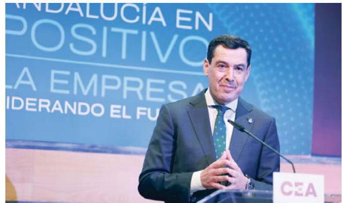
Juanma Moreno interviene en la clausura del ciclo de la CEA 'Andalucía en positivo'.

"Tenemos que empezar a virar hacia países, especialmente en Asia, donde tenemos mercados que aprecian mucho los productos andaluces", indicó el presidente, refiriéndose a Japón o China, al cual realizó una visita en agosto del 2024 lo que posibilitó abrir "unas buenas relaciones institucionales que están generando una inercia que puede ser positiva". Señaló que su Gobierno también está trabajando en "una acción comercial en Japón, especialmente porque se nos están cesando algunos productos en Estados Unidos" y ese país asiático tiene un nivel de renta "bastante alto".