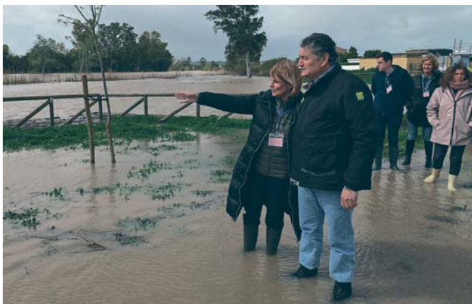
La alcaldesa de Jerez junto al consejero de Presidencia, durante la visita a la zona afectada.

No obstante, Sanz ha querido destacar los dos factores que han contribuido a que la jornada haya transcurrido