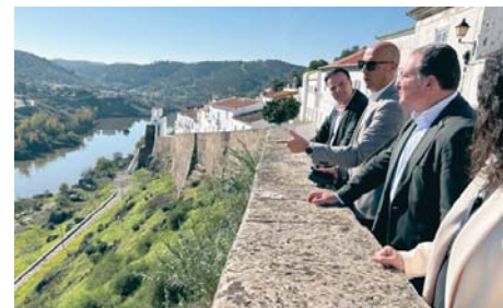
Visita de David Toscano a Mértola. VH

Durante el encuentro, que incluyó un recorrido por el municipio con parada en puntos como los nuevos baños árabes, las instalaciones del Centro de Recuperación del Conejo y la Liebre Ibérica y las obras de rehabilitación de un silo, donde irá ubicada la Estación Biológica, se centraron en la experiencia positiva de