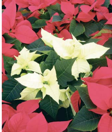
La flor de Pascua blanca se abre camino en el mercado.

De esa cantidad de unidades, Europa registra 95 millones, de los que España aporta un total de