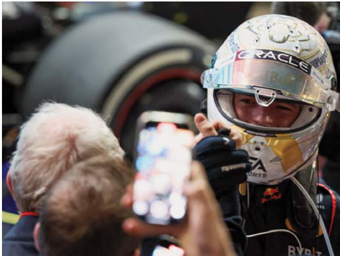
Max Verstappen choca la mano al asesor de Red Bull Motorsport, Helmut Marko.

Por detrás de los dos españoles cruzó la meta el chino Guanyu Zhou, que ayer logró