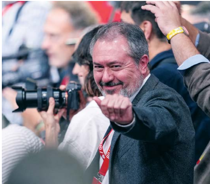
El líder del PSOE de Andalucía, Juan Espadas, durante el 41 Congreso Federal.

Por ello, los socialistas andaluces tenían la esperanza de que Pedro Sánchez, durante su intervención en el conclave nacional celebrado en Sevilla, se decantara con Espadas o abriera un nuevo horizonte con otro equipo.