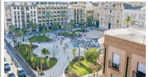
Plaza de La Merced el día de su inauguración. VGPALACIOS