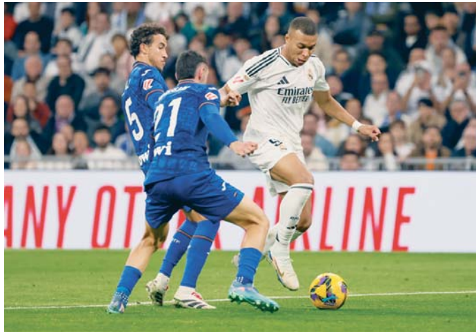
El delantero francés del Real Madrid Kylian Mbappé (d) ante dos rivales del Getafe.

todo y de todas las maneras, pero le volvió a faltar acierto en los desbordes y en el remate. De haber estado algo más afinado el Real Madrid podría haber obtenido un resultado más amplio. En cambio tuvo que ver cómo el Getafe, que queda empatado con el Espanyol justo fuera de la zona de descenso, estuvo a punto de situarse en disposición de dar un susto.