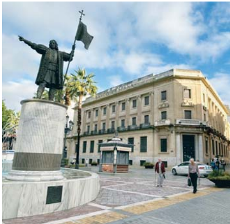
Edificio del Banco de España de Huelva.

De este modo, el nuevo documento indica que se produjeron "dos nuevas situaciones" que inciden en el valor patrimonial del edificio "a las que el nuevo proyecto ha de dar respuesta". De un lado, los hallazgos producidos por la intervención arqueológica de actividad preventiva en el área del patio medianero de la edificación y, por otro, la estruc-