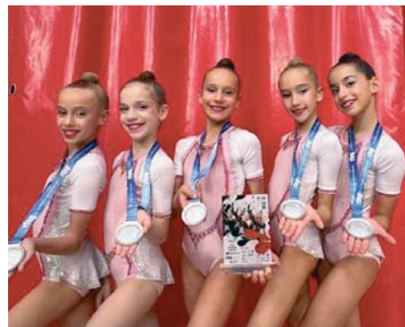
Equipo alevín del GR Huelva, subcampeón de España. VH

También en Zaragoza se disputó el Campeonato de España de conjuntos en categoría base donde las gimnastas del onubense participaron con el conjunto benjamín, consiguieron la novena posición; el conjunto cadete, que acabó en la posición 43 y; el conjunto alevín, que terminó noveno.