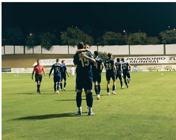
Celebración del único gol del Decano ante el líder Antequera.