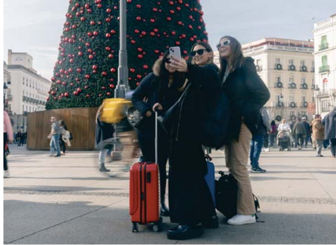
Un grupo de turistas se hacen fotos junto al árbol de Navidad de la Puerta del Sol de Madrid.

Los datos que deben dar de los clientes son nombre y apellidos, sexo, DNI, nacionalidad, fecha de nacimiento, lugar de residencia habitual, teléfonos, correo electrónico, número de viajeros y relación de parentesco (en el caso de que alguno sea menor de