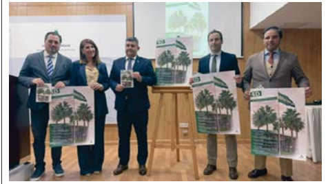
Presentación de la programación del 4D en Huelva. VH

JUNTA El acto principal, en el Muelle del Tinto