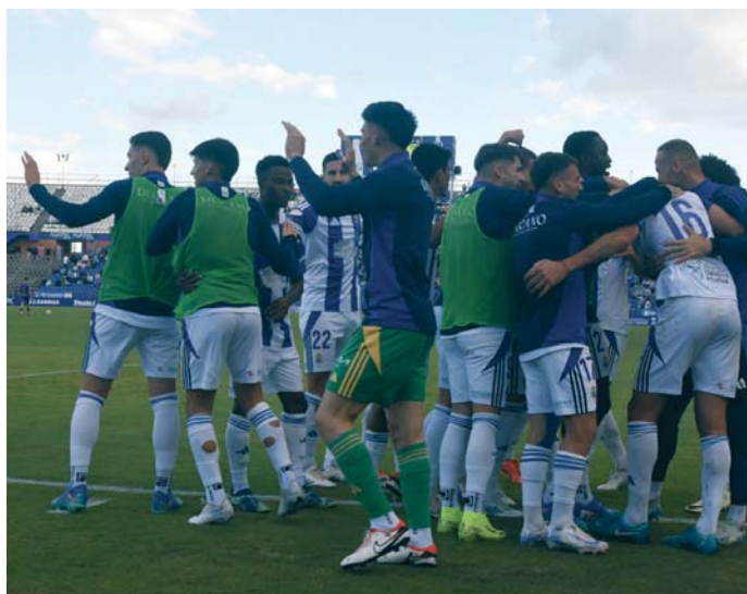
Futbolistas del Recreativo de Huelva celebrando uno de los goles conseguidos en el Nuevo Colomino. TENOR

El Recre debe recuperar su mejor versión e intentar ganar