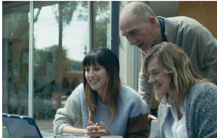
Emma Suárez, Natalia de Molina y Darío Grandinetti, en un momento de la película.

Presenta la historia de una familia atrapada “en una cotidianeidad enfermiza” y con el tabú de la adicción como protagonista: “ese elefante en la habitación que nadie quiere ver y del que nadie quiere hablar”, según su sinop-