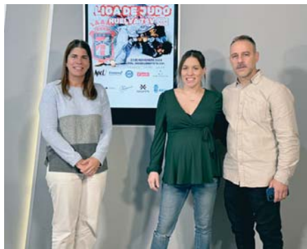
Presentación de la I Liga de Judo TSV. VH

Además comentó que “el objetivo con el que se celebra este evento es fomentar este deporte entre los más jóvenes, ofreciendo una plataforma para que muestren sus habilidades y talento”.