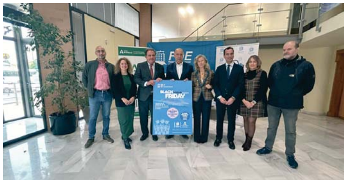
Presentación de la Campaña de Black Friday de Huelva Comercio.

Cerca de 600 negocios participarán en una campaña que se alargará durante toda la semana, empezando el próximo lunes, aunque el día grande será el viernes 29, Black Friday, que coincide en el caso de la capital onubense con el encendido del alumbrado, una decisión que el