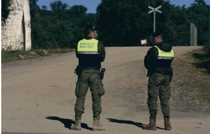
Militares acordonando la zona.

El juez dictó el pasado 29 de julio pasado un auto de procesamiento contra seis mandos de la base militar de Cerro Muriano, donde tiene su sede