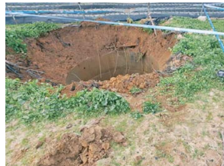
Cierre de pozos en Lucena del Puerto, CHG

Por último, los titulares de la Masa de Agua Subterránea ‘La Rocina’, una de las tres que componen el acuífero de Doñana junto con ‘Almonte’ y ‘Marismas’ han aprobado el proyecto de estatutos y reglamentos para el funcionamiento de