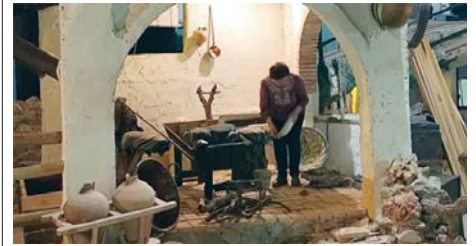
Trabajos en el Belén Viviente de Beas. VH