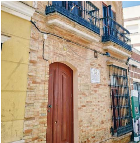
Casa en la que vivió Blas Infante en Isla Cristina. VH

El Consistorio isleño pretende así volver a darle el esplendor a la casa del considerado padre de Andalucía, poniéndola a punto para inte-