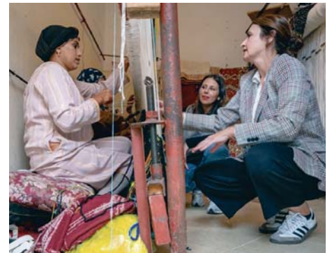
Visita a Marruecos. VV

Hasta la fecha, son nueve las ideas que han tomado forma y se han comenzado a desarrollar por parte de trabajadoras marroquíes en su país.