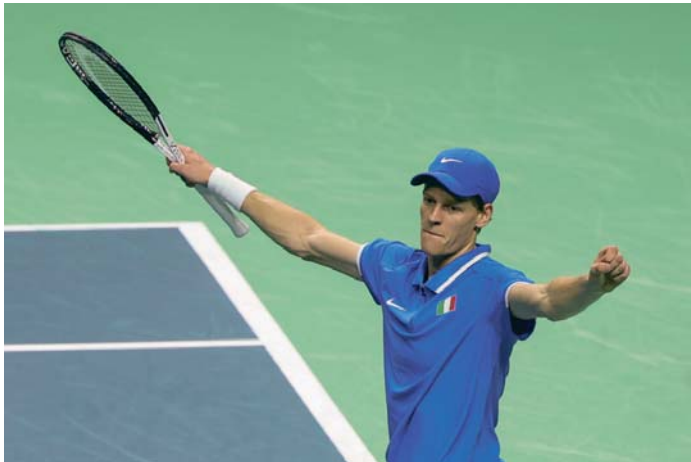
Jannik Sinner celebra su victoria en la final de la Copa Davis celebrada en Málaga.

Acabó Sinner la tarea y antes de celebrar el segundo éxito consecutivo para la escuadra azzurra fue a felicitar al rival. El equipo revelación del torneo al que no le bastó con el instinto de supervivencia que mostró a lo largo de la competición y que reflejó Griekspoor, sobre todo en la primera manga, cuando llevó