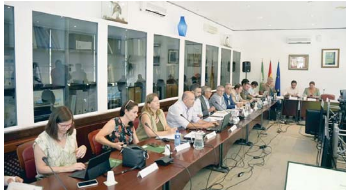
Pleno del Consejo de Participación de Doñana celebrado el pasado mes de julio. EP

El informe, al que ha tenido acceso Europa Press, señala que la precipitación del año hidrológico 2023/24 fue de 473 mm -octubre 2023-septiembre 2024-, con un 91% de la media, aunque “muy atípico”, con “un invierno muy húmedo y el resto de las estaciones muy secas”. De hecho, “hay una cierta percepción de que ha sido un año húmedo, cuando lo