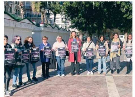
El Movimiento Feminista anuncia la manifestación del lunes. VH

denuncias son reales" y que hay "discursos tan peligrosos que sufrimos por parte de ciertos partidos políticos, que al final hacen que la sociedad crea de verdad que hay denuncias falsas", pero que estas "solo suponen un 0,01%", toda vez que han señalado que "por culpa de esos hombres que matan a mujeres hay más de