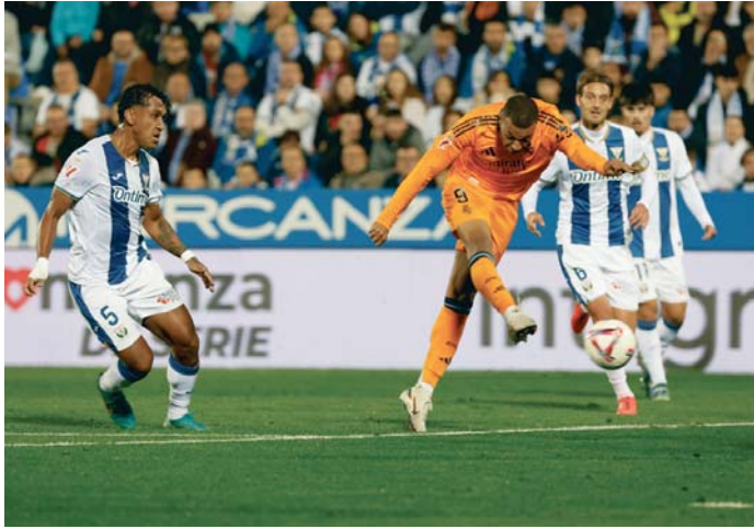
El delantero Kylian Mbappé (c) remata a puerta ante los jugadores del Leganés.

Un lanzamiento de falta de Valverde dispuso las esperanzas del equipo leganense de tratar de cambiar el rumbo (m.66), y un testarazo de Bellingham tras un balón al larguero (m.85) dio la puntilla a un partido en el que se vio a un