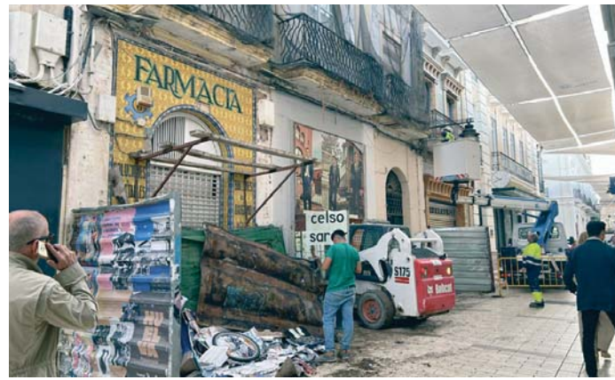
Fachada de la farmacia pocos días antes del derribo total del edificio.

En ese momento, el inmueble contaba con un inquilino en régimen de arrendamiento "que no quiso abandonarlo para acometer las medidas conservativas necesarias", motivo por el que "se produce un deterioro progresivo del edificio, agravándose los da-