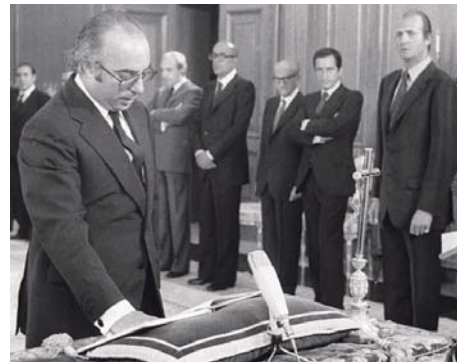
Félix Manuel Pérez Miyares, jura como ministro de Trabajo en 1980.

Asimismo, fue consejero de Agricultura y Pesca de la Junta de Andalucía en el primer gobierno preautonómico y vicepresidente de UCD Andalucía con Manuel Clavero de presidente (1979-1980), así como presidente regional hasta 1982. También fue el primer Delegado General del Gobierno en Andalucía.