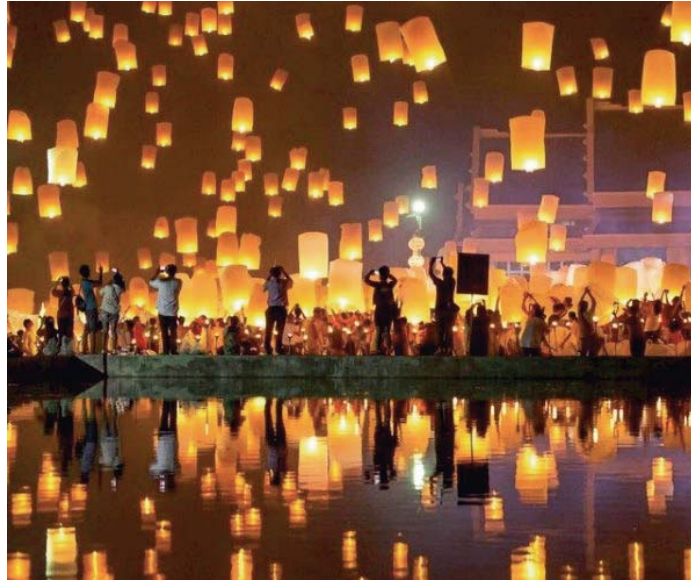
El Festival de las Linternas llegó a Málaga de la mano de Ximenez Entertainment. XIMENEZ GROUP

El segundo proyecto se desarrollará en el parque de atracciones Western Park de Calviá, en Mallorca, un proyecto que revitaliza