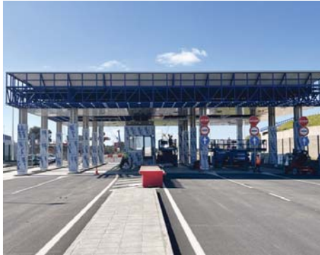
Acceso único al Puerto Exterior. VH

Este proyecto completa las obras de acceso a las inmediaciones del Muelle Ingeniero Juan Gonzalo, desde la intersección a nivel existente ti-