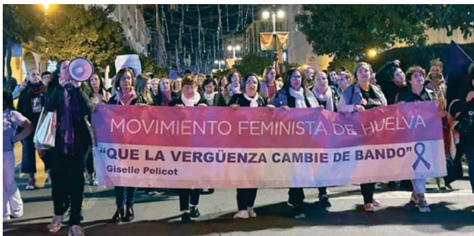
Manifestación del Movimiento Feminista en el 25N onubense.

Ya lo advirtieron en la presentación de la manifestación: "Este año salimos con mucha rabia porque todavía siguen en auge esos discursos inhumanos que niegan esta violencia que es tan explícita y tan cotidiana que da vergüenza negarla, pero también salimos con mucha fuerza porque tenemos el ejemplo de Giselle Pelicot, que creemos que está dando una lección magistral al mundo entero y que está poniendo sobre la