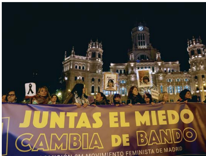
Grupos de mujeres participan en la manifestación convocada por la Comisión 8M en Madrid.

REDACCIÓN. EFE | Miles de personas han recorrido las calles de numerosas ciudades, de Barcelona a Toledo, Valencia o Sevilla, pasando por Madrid, en el Día Internacional contra la Violencia contra las Mujeres, que suma ya 41 víctimas en España, a la espera de confirmar un último crimen, el de una adolescente de 15 años. El lema escogido este 25N ha sido que la vergüenza cambie de bando, con el caso Pelicot -la mujer que fue drogada por su marido para que decenas de hombres la violaran- como telón de fondo.