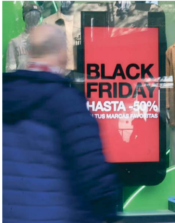
Un escaparate muestra el descuento de algunas prendas con motivo del 'Black Friday'.

El informe de KPMG añade que se espera un aumento de entre el 18 % y el 24 % en las ventas en comparación con el periodo de ofertas de 2023, con una participación del 70 % de los consumidores