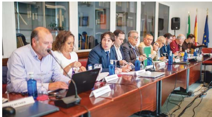
Celebración del pleno del Consejo de Participación de Doñana este lunes. VH

García también ha hecho hincapié en la necesidad de reforzar la coordinación entre ad-