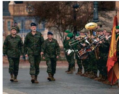
Visita del rey Felipe VI a Sevilla.

El monarca ha podido observar por primera vez el relevante papel que juega este cuartel en el Ejército de Tierra. Como ha informado el comandante Antonio Rastrojo, el Cuartel General FUTER se encarga de la preparación de las unidades de su ámbito y la generación de capacidades para constituir de forma "rápida y eficaz", estructuras operativas terrestres.