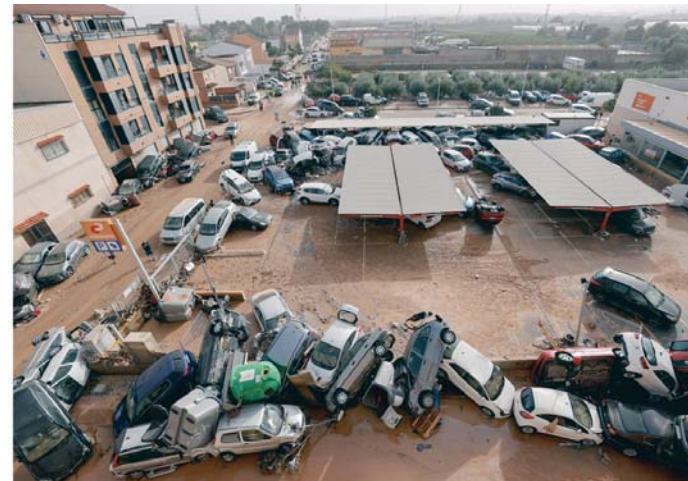
Vista general de vehículos dañados en Paiporta, tras las lluvias causadas por la DANA.

Más de 22.000 transportistas se han visto afectados por el cierre de los principales ejes