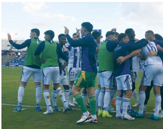
Futbolistas del Recreativo celebrando el gol de la victoria del pasado domingo ante la AD Alcorcón.