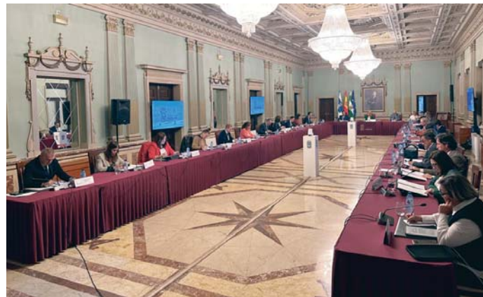
Pleno ordinario del mes de octubre celebrado este miércoles en el Ayuntamiento de Huelva.

PLENO Aprobación definitiva de su Estudio de Detalle