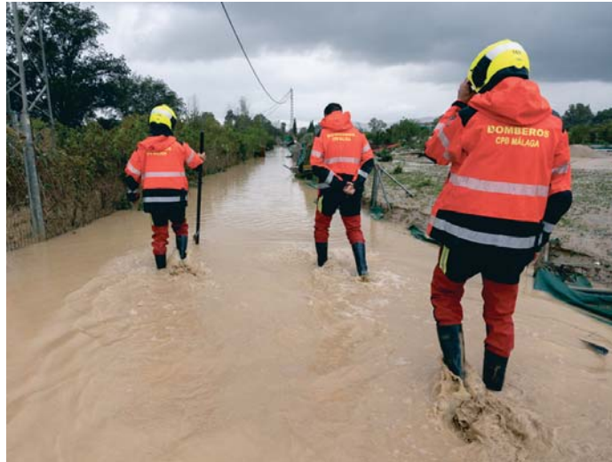
Un grupo de bomberos inspeccionan la barrida de Doña Ana en Cártama en Málaga.

Por su parte, el presidente andaluz, Juanma Moreno, volvió a pedir a los ciudadanos que tengan precaución porque la comunidad mantiene avisos por lluvias intensas. "Evitemos desplazamientos innecesarios y mucho cuidado con la crecida del cauce de los ríos en