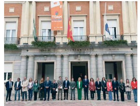
Minuto de silencio a las puertas del Ayuntamiento de Huelva. VH

El actual centro de acogida para transeúntos San Sebastián dispone de un total de 17 plazas.