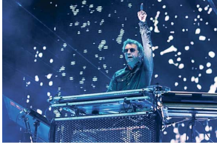
El compositor y artista galo Jean-Michel Jarre durante uno de sus últimos conciertos.

Su catálogo actual incluye 22 álbumes de estudio, de los que se han vendido más de 85 millones de copias en todo el mundo, y le han valido innumerables premios y nominaciones.