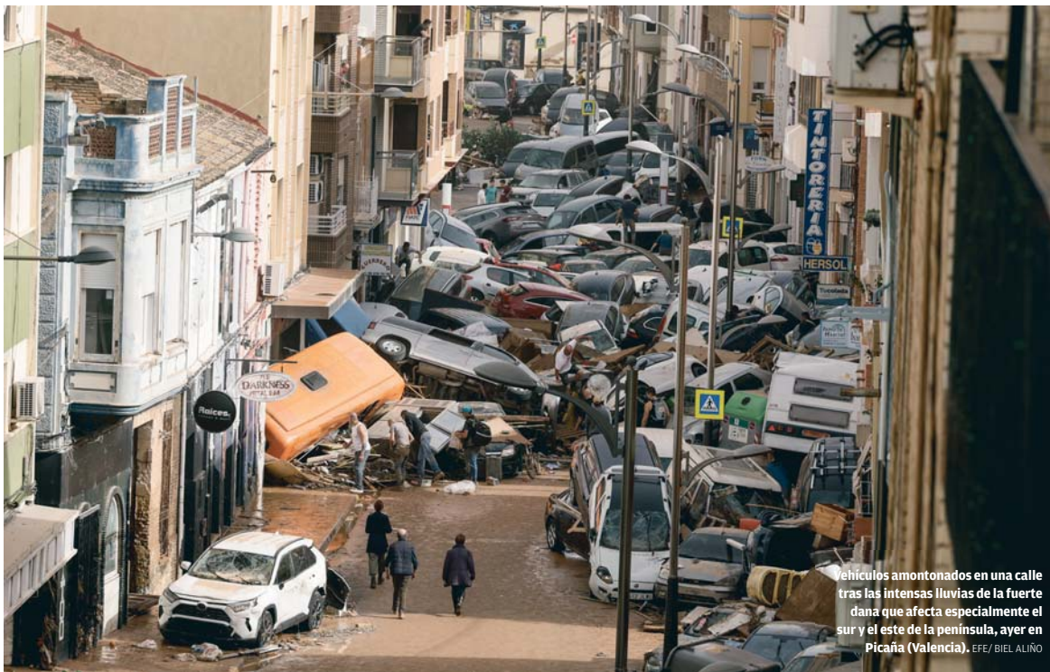
Vehículos amontonados en una calle tras las intensas lluvias de la fuerte dana que afecta especialmente el sur y el este de la península, ayer en Pícaña (Valencia).

HUELVA Minutos de silencio y puertas abiertas en el centro de personas sin hogar por el temporal