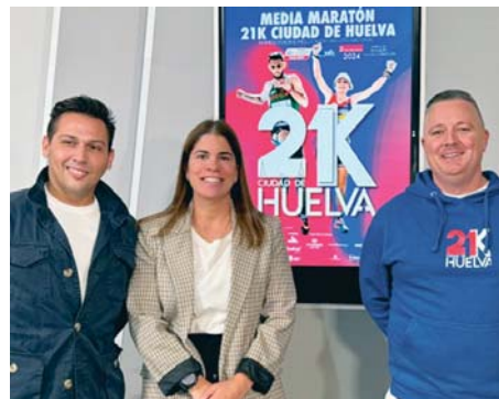
Presentación de la segunda edición de la 21K Ciudad de Huelva. VH

La prueba partirá desde la Plaza de la Constitución, "que es donde también culminará la prueba, y transitará por la mayoría de los barrios de la ciudad, haciendo un recorrido enfocado a mostrar nuestros mayores reclamos turísticos, pasando por lugares como el Santuario de la Cinta, el Parque Moret o el Barrio Obrero".